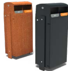
BORG 2 STROMINGEN 50L